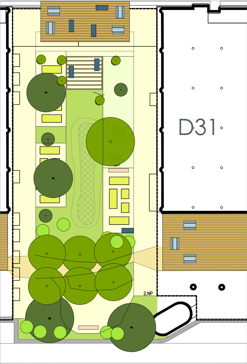
D 31, SITUACE, M1:300